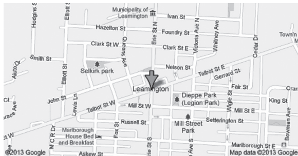
FIGURA 4. Ubicación de las calles Talbot St. East y Erie St. North

Los datos seleccionados son una muestra para la exploración del PL bilingüe/multilingüe (Cenoz & Gorter, 2006) a través del uso del lenguaje en letreros y anuncios que sirvieron, junto con la información proveniente de los cuestionarios cortos, como las unidades de análisis. Cada establecimiento participante en esta muestra fue seleccionado con base en la presencia del español en los anuncios expuestos afuera de sus locales. Una vez detectado el uso del español (ya fuera en el anuncio principal o en la información de los anuncios en el escaparate), se recabó más información mediante fotografías y la aplicación de un cuestionario corto, con una combinación de preguntas cerradas y abiertas que tenía como objetivo entender la justificación de usar el español en el PL del establecimiento. El cuestionario fue realizado por la investigadora en español o inglés, de acuerdo a la lengua de los encuestados, ya fuera su lengua materna o su segunda lengua cuando la lengua materna era otra (es decir, árabe, alemán, indonés, italiano o portugués). De los 20 encuestados, 11 eran hombres y 9 eran mujeres con un rango de edad muy variable (desde los 17 hasta los 60 años de edad).