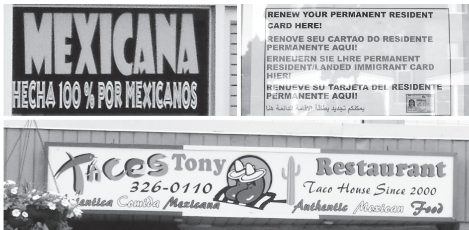
FIGURA 5. Anuncios que destacan el uso del español

Los negocios de esa zona atienden a la población hispana de la región, aunque esto no necesariamente implique que en esos establecimientos se hable español (a pesar de que parecería obvio que fuera así). Al parecer y de acuerdo a