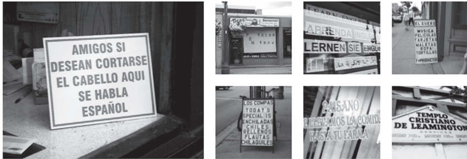
FIGURA 3. PL bilingüe/multilingüe en Leamington