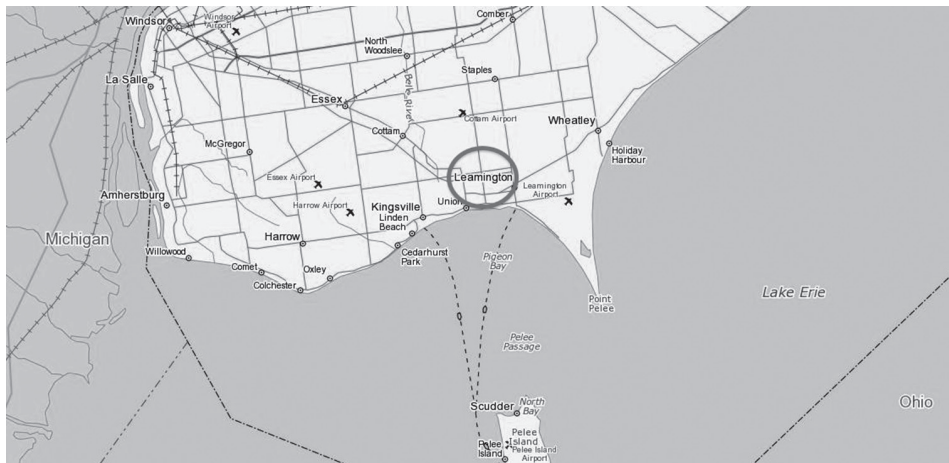
FIGURA 2. Municipalidad de Leamington, Ontario

Leamington tiene una alta actividad agrícola y, por lo tanto, es una de las comunidades de acogida de trabajadores agrícolas temporales que vienen a Canadá cada año procedentes de Jamaica y México, principalmente. Tiene una población de 28403 habitantes (Statistics Canada, 2012) y cada temporada recibe alrededor de 4000 trabajadores agrícolas temporales mexicanos como parte de un programa bilateral entre los gobiernos de México y Canadá para aliviar, por un lado, el desempleo en el primero de estos países y, por el otro, solucionar la de-