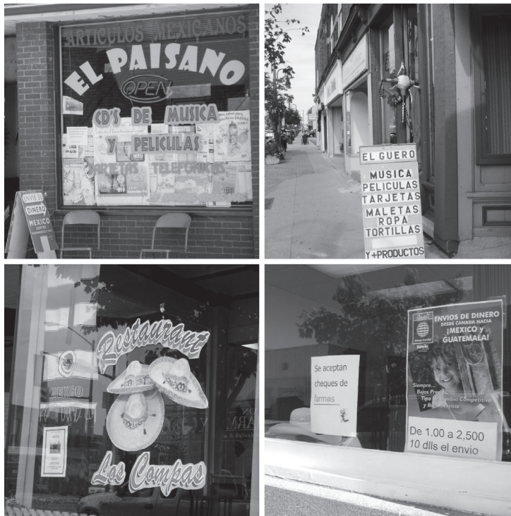
FIGURA 6. Anuncios en español en establecimientos de Leamington

Es importante mencionar que la selección de lenguaje en el PL de la muestra de este estudio señala que el uso del español es relevante –similar a lo que Franco-Rodríguez (2008) encontró en su estudio–, como puede comprobarlo cualquiera que visite Leamington. La presencia del español en el PL del centro de Leamington muestra la capacidad que tiene el PL de reflejar no solo la realidad sociolingüística de las comunidades, sino también la demanda lingüística basada en un mercado potencial (aunque temporal) de consumidores (ver Figura 6).