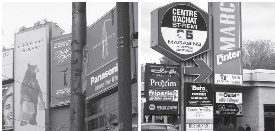
FIGURA 1. Lenguas oficiales en el PL canadiense

En el entorno canadiense, la presencia de una o ambas de las lenguas oficiales del país (ver Figura 1) implica la presencia demográfica de uno de los grupos etnolingüísticos que conforman los grupos mayoritarios, anglófonos o francófonos, en una región específica. Sin embargo, ya que Canadá se encuentra constituido por una población multicultural y en consecuencia una población con diferentes grupos etnolingüísticos, es inevitable encontrar, al menos en las grandes zonas metropolitanas –como lo son Montreal, Toronto o Vancouver–, la presencia de una lengua no-oficial que puede ser el árabe, el mandarín o el español, entre otras. La presencia o ausencia de una lengua minoritaria y no-oficial también parece