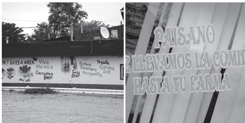
FIGURA 7. Anuncios para atraer a los TATM

Finalmente, en cuanto a los recursos lingüísticos usados en el PL, es posible ver que el más usado es la mezcla de lenguaje (español/inglés) y en menor grado el uso de préstamos léxicos, como extranjerismos adaptados (por ejemplo, farma , en lugar de farm ‘granja’) (ver Figura 7). La razón por la cual es posible que no exista un mayor uso de recursos lingüísticos, como serían los calcos léxicos, neologismos, falsos cognados, etc., se debe quizás a que los TATM son inmigrantes temporales y que, por lo tanto, no se ha dado un proceso natural de lenguas en contacto en la región que se pueda ver reflejado en el PL. Por otra parte, también es posible que sea debido a que los PL usan la lengua escrita y esta tiende a usarse en una variedad estándar donde el uso del español oral, con otro tipo de fenómenos lingüísticos como los antes mencionados, no siempre se logran ver reflejados. Por último, el hecho de que casi la mitad de los propietarios de los establecimientos que conformaron la muestra de este estudio no son hispanos, hace suponer que estos busquen ayuda para traducir la información que quieren llevar a los consumidores y, por lo tanto, la lengua usada en las traducciones sea la estándar, aunque con influencias del inglés, como puede observarse en las traducciones que incluyen transferencias literales, falta de acentos y de signos de puntuación.