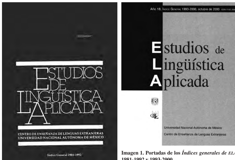
Imagen 1. Portadas de los Índices generales de ELA 1981-1992 y 1993-2000

Estos Índices generales , fuente fundamental de la información que analiza este reporte, constan de tres partes: la primera presenta las tablas de contenido de los números de la revista. La segunda parte es un índice temático. La tercera parte contiene el índice alfabético de autores, artículos y reseñas. Además del título y el resumen se anotan los datos del autor y las siglas de la institución de su adscripción laboral.